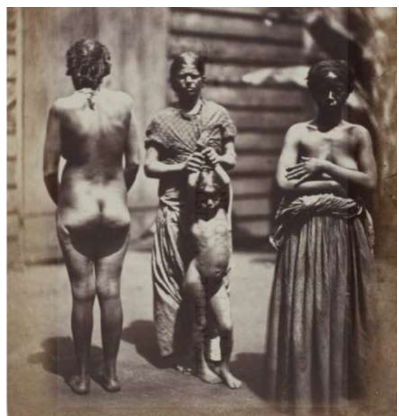
Désiré Charnay. Femmes malgaches, Indienne et enfant indien . Photographie - 1863

Grand admirateur d'Andy Warhol, les images de ces hommes et de ces femmes se déclinent en série. Cette idée de série apparaît également dans les corps en pictogramme révélant des motifs picturaux, ou encore des éléments de langage par la mise en place de Lalfabé , où les postures de personnages anonymes se transforment en signes.