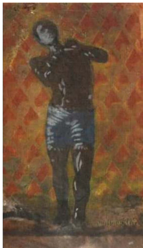
W.Zitte. Le porteur . Peinture sur toile de jute - 1991

L'importance de la lumière dans le travail de William Zitte est palpable autant dans la confrontation du noir et du blanc de ses pochoirs que dans ses lampes et sculptures métalliques conçues à cet effet. Les Ti bondiés , ces petits autels sacristiques ornés de bougies guidant le parcours muséographique, abritent la Tèt Kaf tel un symbole élevé au rang du sacré.