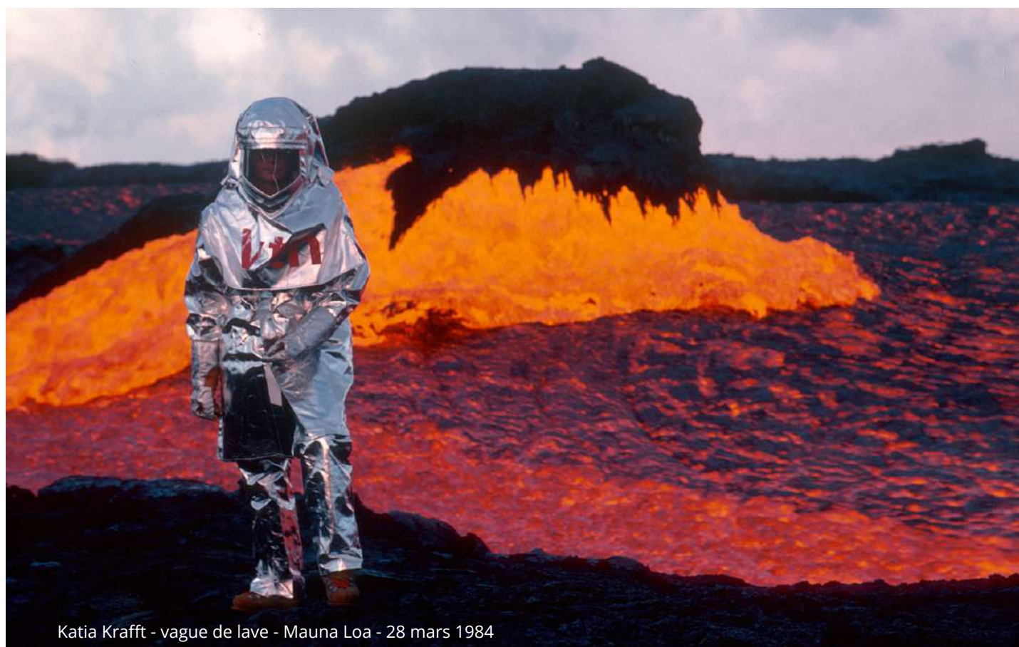
Katia Krafft - vague de lave - Mauna Loa - 28 mars 1984