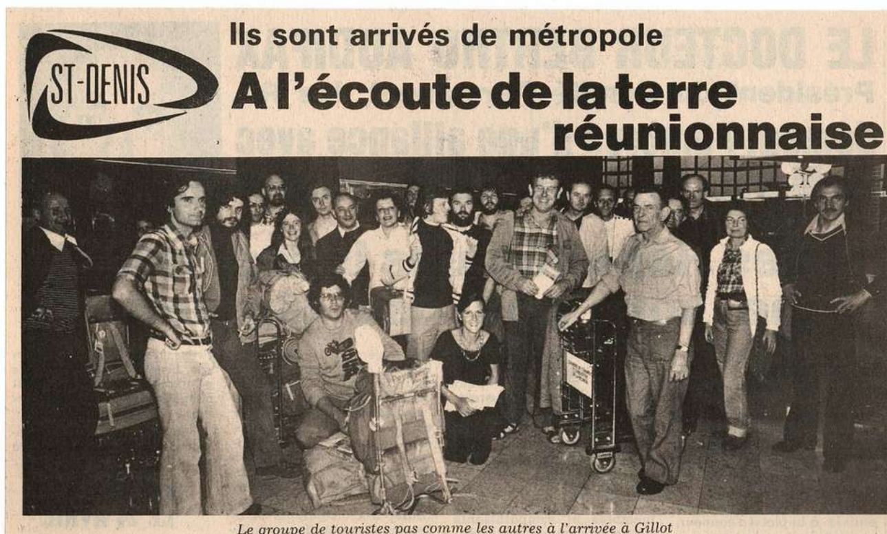
1977, Article du Journal de l'île de La Réunion signé M. L. datés du 04 novembre.