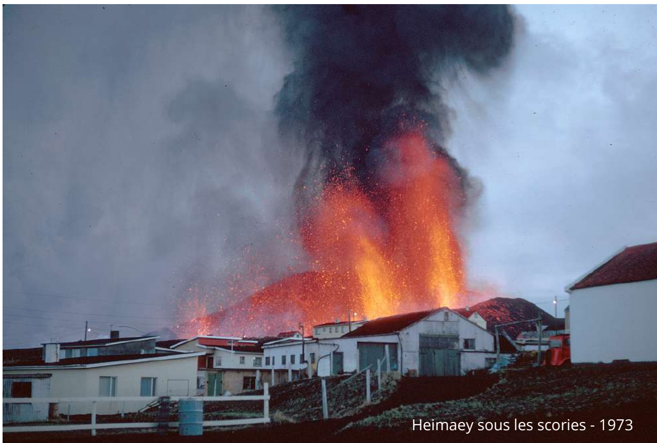
Heimaey sous les scories - 1973