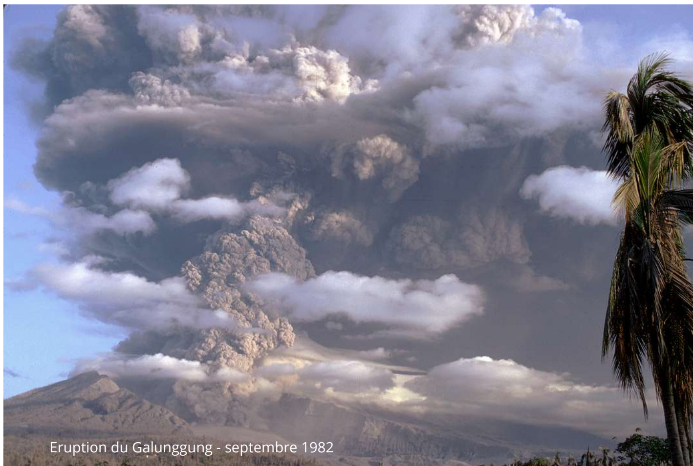
Eruption du Galunggung - septembre 1982