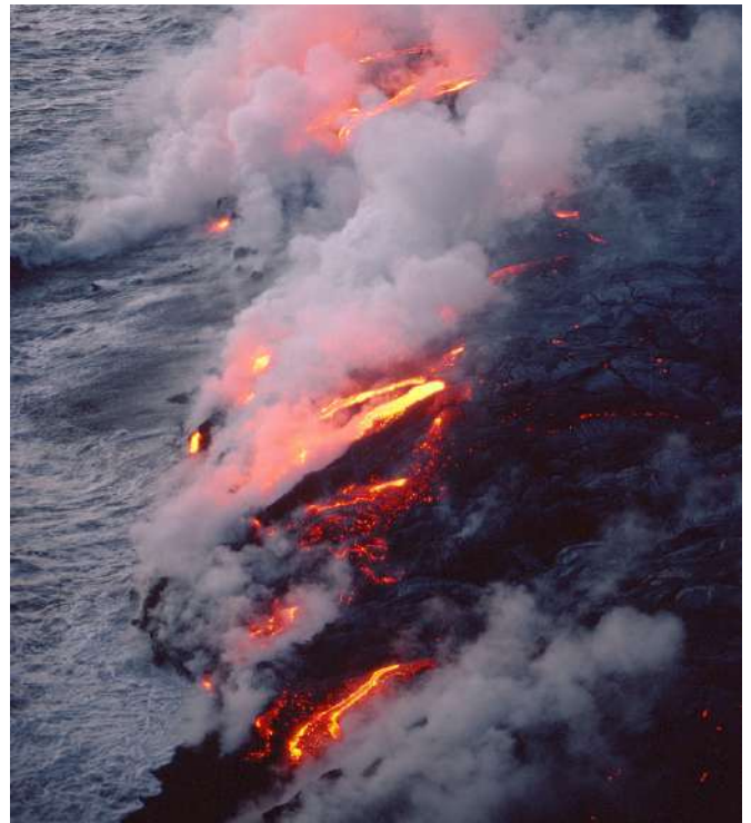
1986, Coulées des 25 et 26 mars du Piton de La Fournaise se jetant dans la mer.