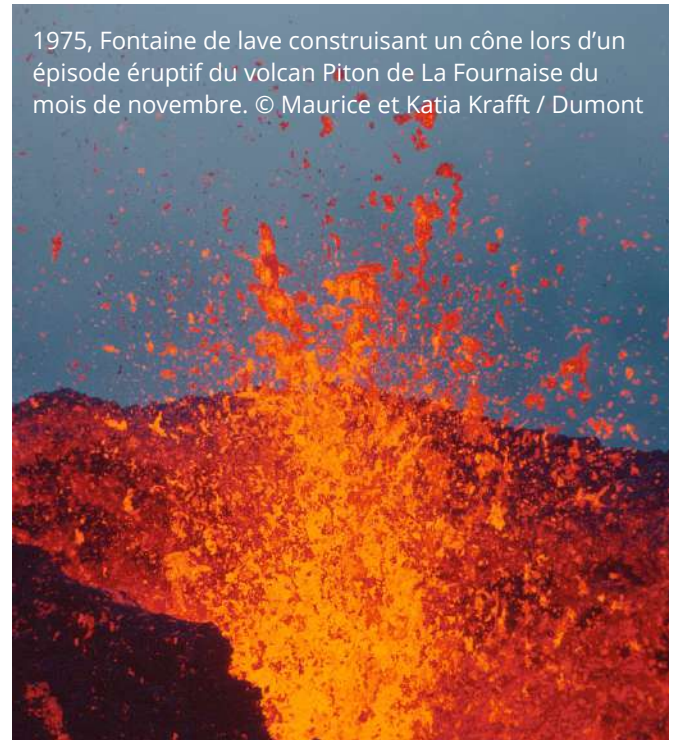
1975, Fontaine de lave construisant un cône lors d'un épisode éruptif du volcan Piton de La Fournaise du mois de novembre.

Entre novembre 1975 et avril 1976, Maurice et Katia vont suivre sept crises éruptives du Piton de La Fournaise. Katia écrit dans son carnet de terrain : « A trois heures trente, la tempête se lève. En une demi-heure, la tente est transformée en piscine. On éponge moins vite que l'eau ne rentre. Le double toit est arraché par le vent... On essaie de colmater les trous faits par les bombes volcaniques dans la toile de tente. .. On dégage une odeur de soufre comme des diabolotins sortis de l'enfer... On quitte le cratère que nous veillons heure après heure, avec regret, comme on quitte un ami avec qui on a passé des moments inoubliables. »